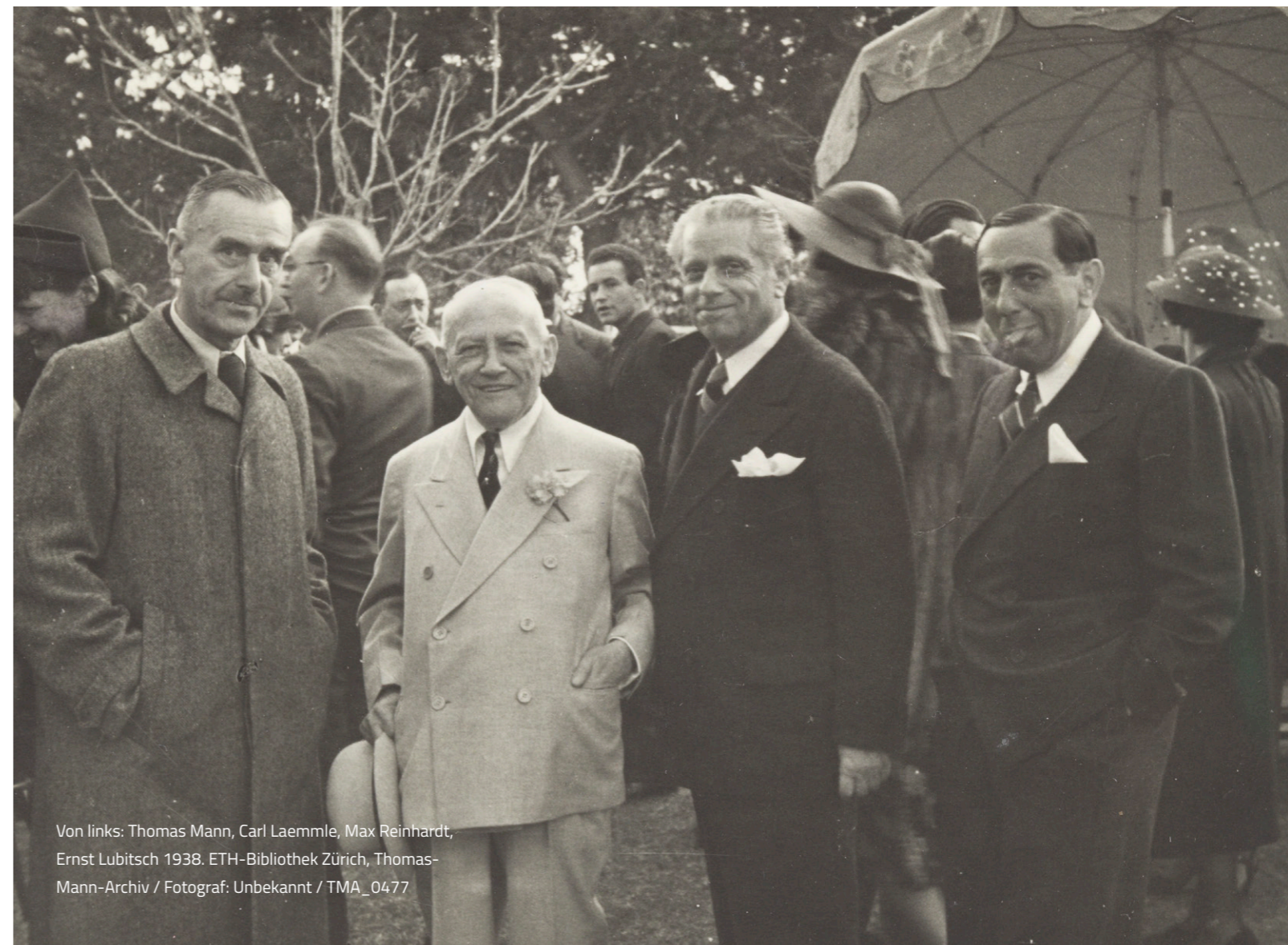
Von links: Thomas Mann, Carl Laemmle, Max Reinhardt, Ernst Lubitsch 1938.

Mein Buch ist kein Text – der Film nicht mein Buch.